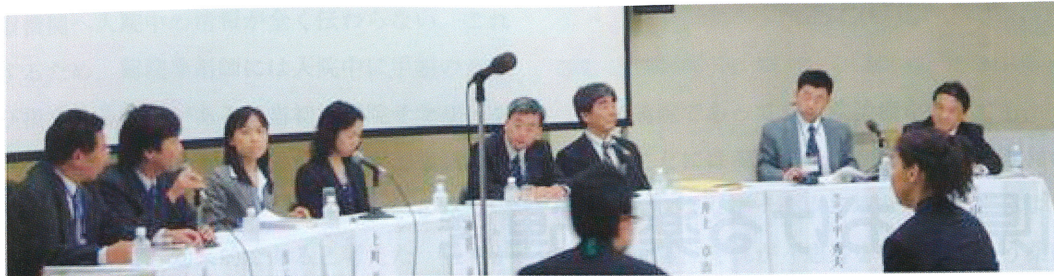
図1 第16回日本医療薬学会シンポジウム「薬業連携について考える」の様子