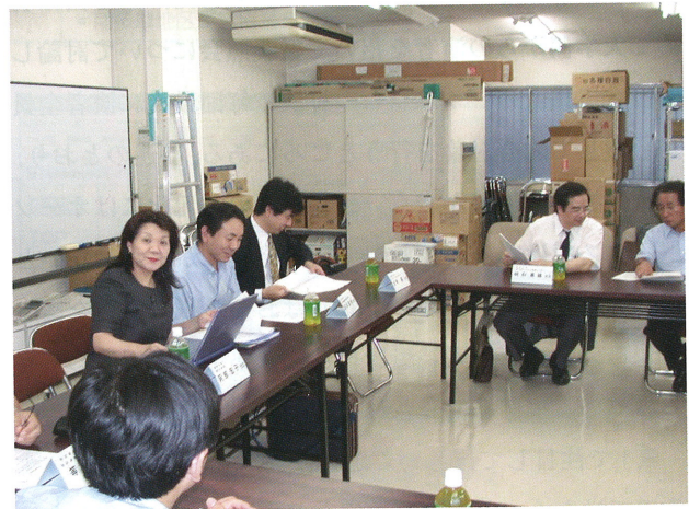
八王子薬剤師会事務局にて、ここでの議論が次回からフォーラムのテーマにつながっている。

図1に多摩地区の薬業連携マップを示した。白抜きは都薬支部委員が所属している市を示し、★は病薬支部委員が所属する病院の位置を示している。薬科大学、薬学部との連携についてはこれまでも、相談役として意見交換をしたり、フォーラムへ参加いただいている。