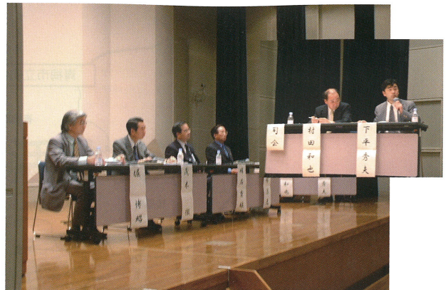
図3 第1回フォーラムの総合討論(平成15年)

どうするかというものが中心だが、毎回議論がかなり白熱している。その議論の中から、自然に我々が同じテーブルで議論すべきことが浮かび上がってきている。第7回的时候は、薬剤師ばかりで議論するのではなく、患者さんの生の声を聴きたいという提案があった 3) 。また、第10回でジェネリック医薬品を取り上げたが議論できる時間が足りなかったため、第11回でも再度ジェネリック医薬品を取り上げ、講演を聴くことに時間を割くよりも、最初から熱く語る趣向とした。このテーマは医薬品卸や先発医薬品企業、ジェネリック医薬品企業にとっては非常にデリケートな問題であったが、あえてメーカーに呼びかけて積極的に参加してもらったことで、参加者から現場の本音を含めた多くの貴重な発言をいただいた 4) 。