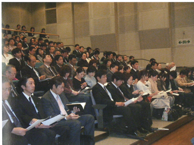
後発医薬品について, 会場は超満員であった。