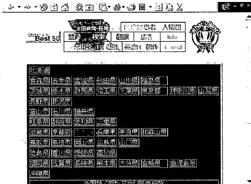
図1-1 「ホームページで探す全国病院・医院ガイド」トップページ http://www.bekkoame.ne.jp/~ontop/

本サイトがリストアップしている病院・医院数は5万件を超える。リンクしているホームページは数百。一般の病院・医院を優先的に進め、歯科医院はホームページを有するところのみ、あるいは登録依頼のあった所が掲載されている。病院名、住所、診療科目で検索する。手話で意思疎通が可能な医療施設なども紹介している。